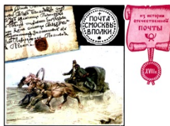
«Почта с Москвы в полки». Художник Комлев Г.

сайта: http://historic.ru/books/item/f00/s00/z0000267/st012.shtml ]