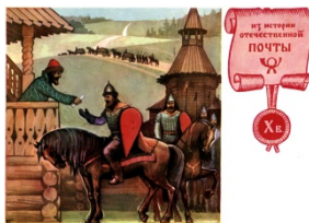
Повоз. Художник Комлев Г.

С X в. в Киевской Руси зарождается натуральная повинность — повоз, по которой население доставляло в определенное место и по определенным дорогам грузы и княжеских вестников.