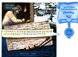
Создание берестяной грамоты. Художник Комлев Г.

Свыше 500 берестяных грамот и множество «писал», инструментов для выдавливания букв на бересте, извлекли советские археологи из раскопок в Новгороде. Эти находки подтверждают не только высокую грамотность новгородцев, но и существование хорошо организованной почтовой связи. Грамоту второй половины XII в., текст которой воспроизведен на рисунке открытки, можно перевести так: «Сыну Кринилы. У Федора Урокеева... А живет во Славне...» Этот почтовый адрес к частному письму — древнейший в мире.