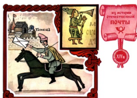
Гонец. Художник Комлев Г.

В Государственном Историческом музее хранится акварель неизвестного художника начала XVII века «Подавление Соловецкого восстания» с изображением гонца. Но это не первый «портрет» посланца. Еще в XIV веке создатели Новгородского псалтыря изобразили вместо заглавной буквы «Г» стилизованную фигуру гонца. В одной руке у него берестяной рожок, в другой — суковатая палка, которой он защищался от нападения собак и разбойников.