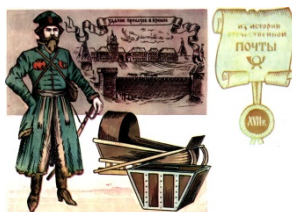
Ямщик. Художник Комлев Г.

На старинной гравюре, хранящейся в Государственном Историческом музее, изображено здание приказов в Московском Кремле. Здесь помещался и Ямской приказ. Среди прочих дел он обеспечивал ямщиков форменной одеждой. Одна из форм (по указу 1669 г.) представлена на рисунке открытки. Здесь же можно увидеть сани и ящик для