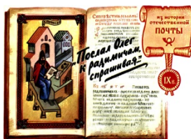
Летописец. Художник Комлев Г.

Точно неизвестно, когда родилась почта на территории нашей Родины. Но уже в 885 г. летописец записал в «Повестях временных лет»: «Послал Олег к Радимичам, спрашивая...» С этих пор все чаще и чаще на страницах русских хроник появляются сообщения о посылках вестников в разные концы Киевской Руси. В 945 г. киевский князь Игорь заключил договор с Византией, в котором специально оговаривался обмен гонцами между двумя государствами.