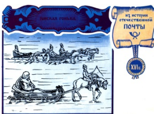
Ямская гоньба. Художник Комлев Г.

Со второй половины XIII в. на смену повозу приходит новый более прогрессивный вид почтовой связи — ямская гоньба. Интересное описание ямской гоньбы первой четверти XVI в. оставил австрийский дипломат Сигизмунд Герберштейн. В книге «Записки о московитских делах» он рассказал о русской почтовой службе. Гонцов Герберштейн называл почтальонами, ямщиков — управляющими почт, а саму гоньбу — почтой задолго до того, как эти слова появились в русском языке. К книге были приложены чертежи Московского Кремля с рисунками. На одном из них изображена езда на санях. Ямщик сидит на лошади, а гонец — в санях.