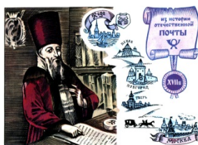
Ордин-Нащокин А. Л. Художник Комлев Г.

Афанасий Лаврентьевич Ордин-Нащокин (около 1605 —1680) — русский дипломат и государственный деятель, организатор «правильной» почтовой гоньбы. С его именем связано главное преобразование в русской почте — создание регулярной гоньбы. Первая такая линия прошла в 1665 г. из Москвы через Псков в Ригу. С 1669 г. стала работать новая «заморская» почта из Москвы в Вильно (Вильнюс). А. Л. Ордин-Нащокиным была задумана скорая гоньба в Архангельск. Началась она в 1693 г. На открытке воспроизведен прижизненный портрет А. Л. Ордин-Нащокина (Государственный Исторический музей), написанный, как предполагают, неизвестным польским художником.