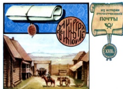
Двор почтовой избы XVIII в. Художник Комлев Г.

Правила оформления отправлений в старину отличались от современных. На письмах от руки делались отметки о времени приема. Затем корреспонденция заворачивалась в плотную бумагу и перевязывалась веревкой. Получался, как тогда говорили, «связок».