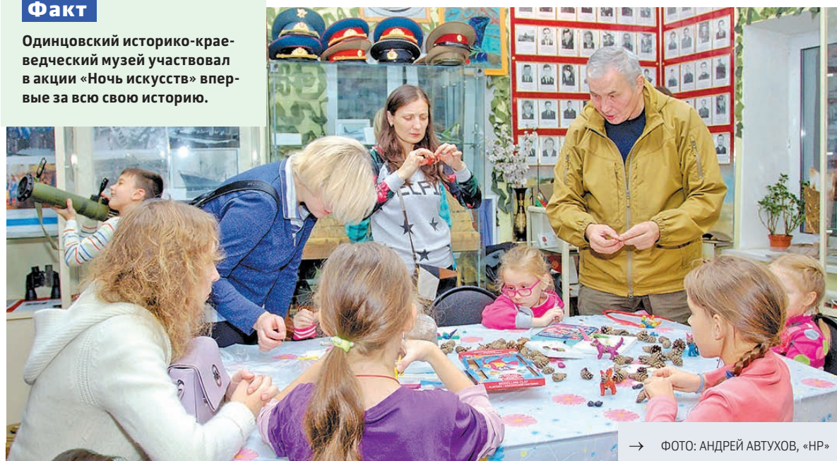
→ ФОТО: АНДРЕЙ АВТУХОВ, «НР»

Одинцовский историко-краеведческий музей участвовал в акции «Ночь искусств» впервые за всю свою историю.